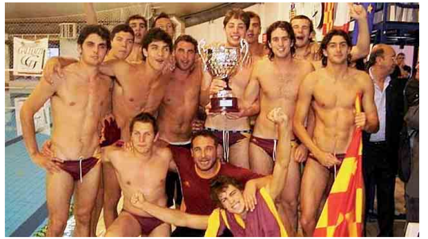
Da anni l'Imperia punta sul vivaio: ora raccoglie i frutti ai massimi livelli